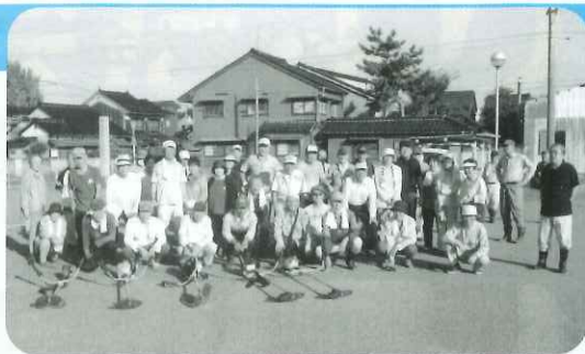
▲四方地区センター（公民館）周辺の除草及び清掃活動 令和5年9月10日(日)AM6:00～7:00に実施

私が担当する長寿会連合会の歴史に先ず簡単に説明致します。旧富山市への合併する前に、婦負郡の中核町で周辺の町や村人達が、日常生活必需品を買い求め、四方町へと人の流動があり、活気ある高店が街道に並び繁栄した町。単位クラブの誕生は昭和30年後半、さて、校下長寿会連合会が設立届けたのは、昭和44年、当時の先代達が人生70年の時代で希望に満ちた5町内会が単位クラブを設立して誕生した始まりです。あれから50年余り、ふる里の未来が続き変わって行く中で、15町内会の単位クラブまで拡大成長しました。が、会員の人々が、住む町々が、老人を取り巻く社会環境と少子高齢化が進行し、私が育った、君達も育った町は一辺、空き家の増加と、60年代の労働問題（年金支給年齢の引き延ばし）で65歳まで労働強要、又、70歳まで自宅と勤め先きの往復生活の疲れで終了した時は、身体の五体満足の方が少なく、会員に加入し町内住民との接触する意欲が先人達が常に持っていた町内協同体の精神を持つ方々が少なく、「今さら、自分の事に干渉しないで」と会員数も減少。加入促進も至難の技。その上、新型