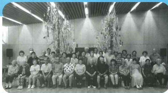
▲七夕の集い 令和5年7月28日(金)

主な活動内容は、社会奉仕活動として、「地区公民館・老人福祉センターの草刈清掃、小学生と交流(稲刈り・縄ない・かがやき教室)等、物故会員追悼法要」。健康づくりとして、「介護予防水飲み運動の推進、ニュースポーツ(ペタンク・カローリング・ボッチャ・パークゴルフ)等年各2回